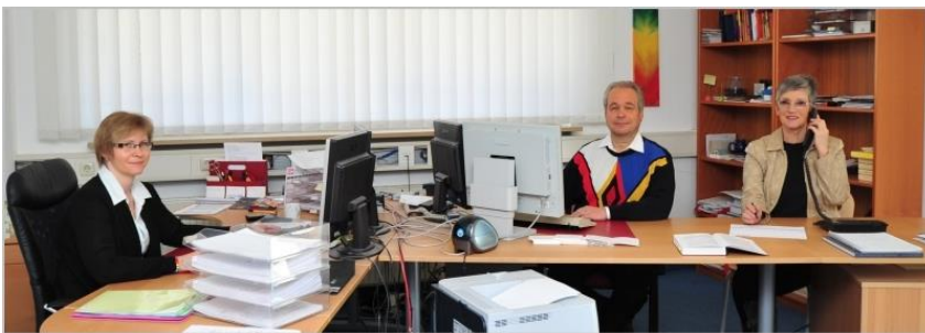
Das Team von Venedig.com www.venedig.com – info@venedig.com

Dieser Reiseführer ist kostenlos und darf für private Zwecke beliebig verwendet und kopiert und weitergegeben werden.