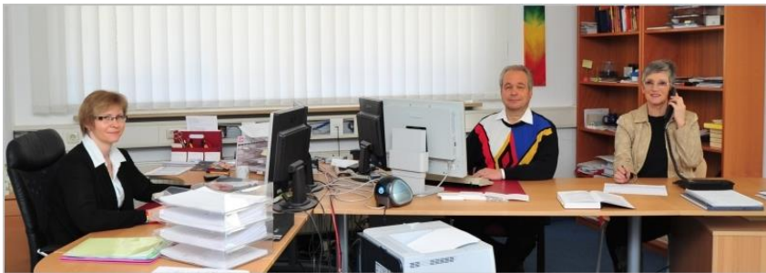
Das Team von Venedig.com www.venedig.com – info@venedig.com

Dieser Reiseführer ist kostenlos und darf für private Zwecke beliebig verwendet und kopiert und weitergegeben werden.