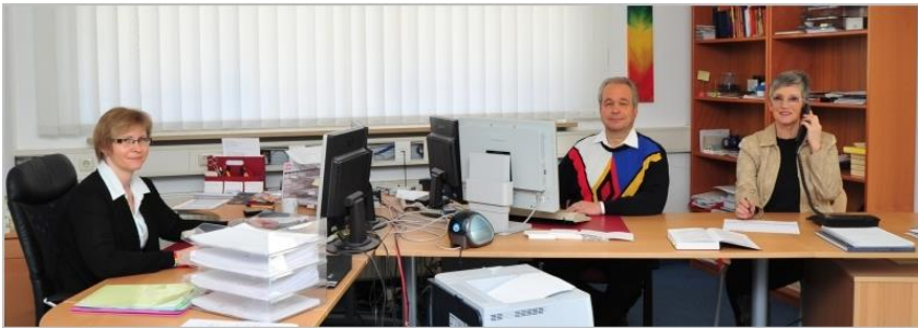
Das Team von Venedig.com www.venedig.com – info@venedig.com

Diesen Ratgeber haben wir nur für die Kunden von Venedig.com und Stadtführungen-Venedig.de geschrieben. Für diese gibt es noch eine Reihe weiterer interessanter und kostenloser Reiseführer. Sie finden diese am Ende dieses Reiseführers aufgelistet.