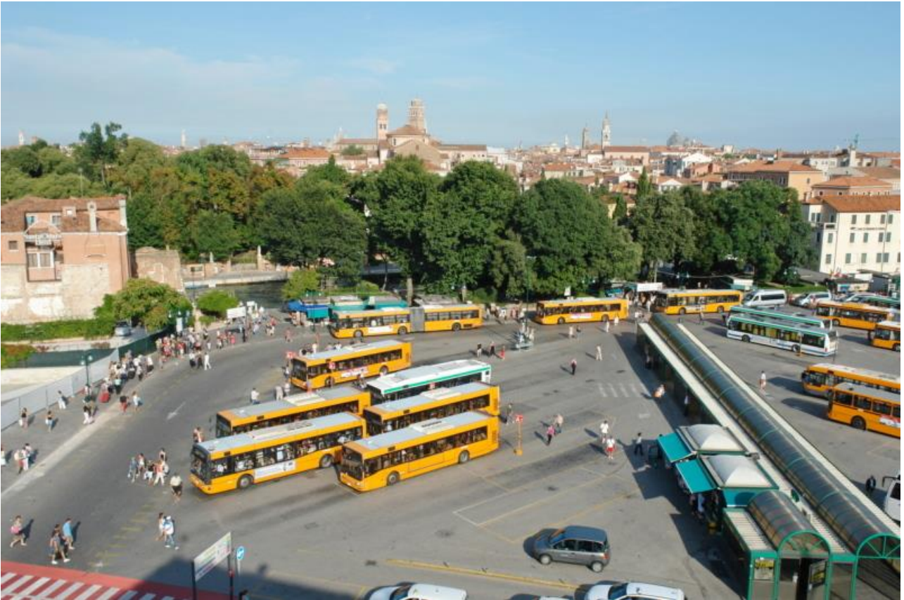
Im Bild der Busbahnhof am Piazzale Roma.

JA, es gibt Venedig Touristen die eine Unterkunft außerhalb von Venedig in Mestre buchen.