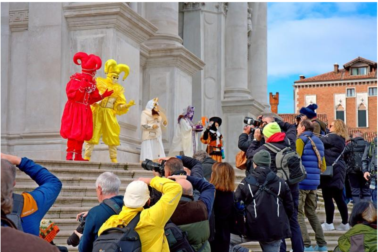
Masken vor der Kirche La Salute.

Ohne Masken keine Zuschauer und ohne Zuschauer keine Masken.