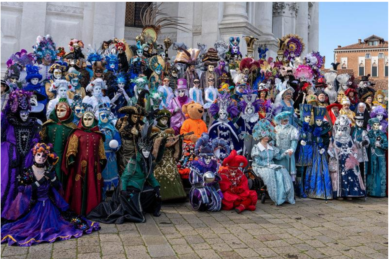
Die Masken vor der Kirche La Salute.

Im Jahr 2025 steht der Karneval unter dem Motto: „Il tempo di Casanova“ (Das Zeitalter von Casanova).