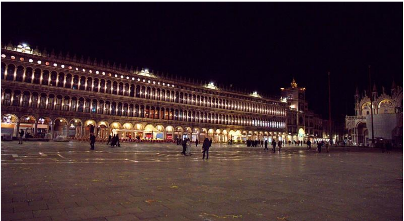
Der Markusplatz um 20:45 Uhr

Und draußen der Markusplatz sieht so aus: