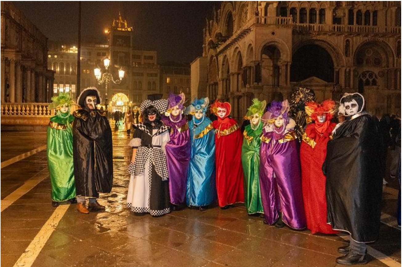
Abends am Markusplatz/Markusdom.