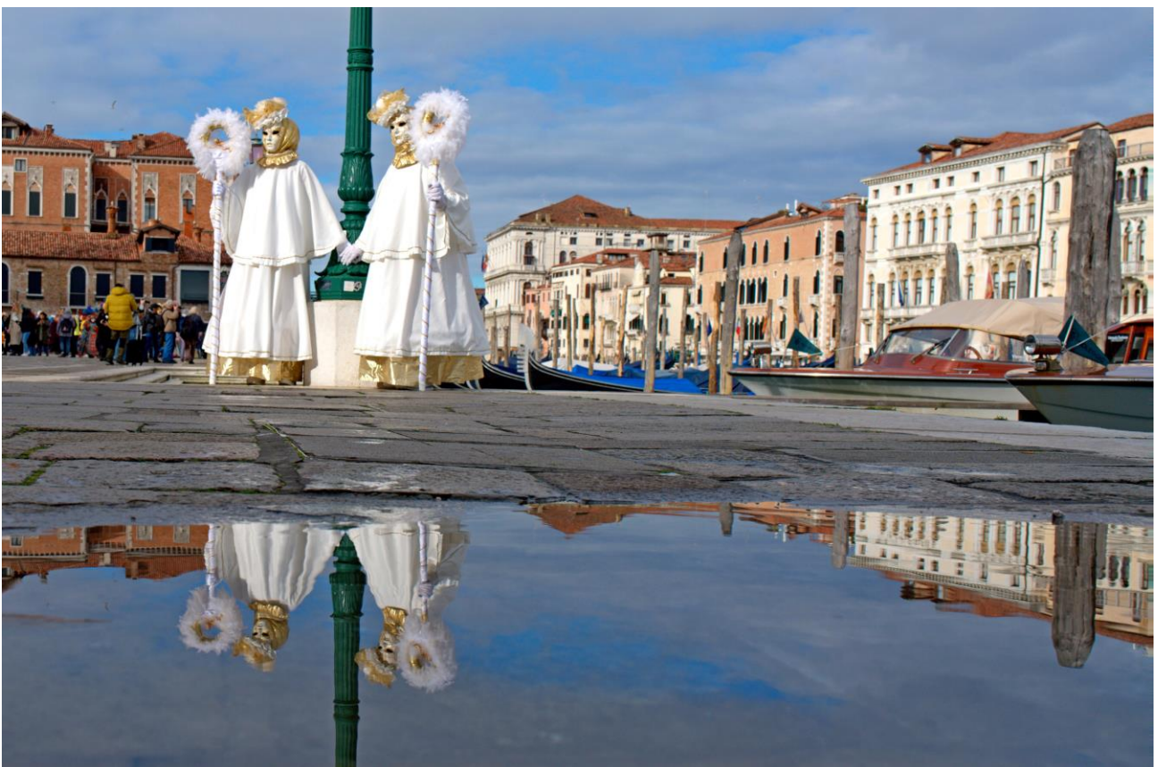
2 (bzw. 4) Masken vor der Kirche La Salute. Zeitpunkt der Aufnahme: 10:30 Uhr

Diese Aufnahme habe ich um 10:30 Uhr gemacht.