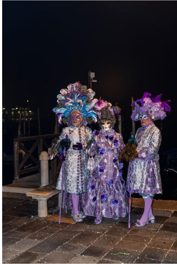
Morgens ganz früh und Abends stören keine tausende von Touristen im Hintergrund