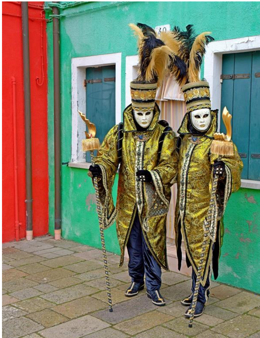
Masken in Burano. Die Aufnahme entstand um 11:25 Uhr

Nehmen Sie dazu die Linie 14 ab der Haltestelle San Marco-San Zaccaria A, oder die Linie 12 ab Fondamente Nove "F.te Nove A"