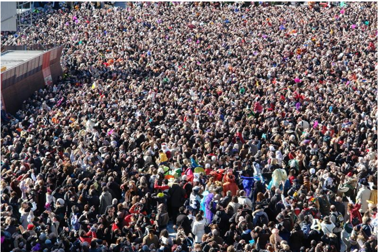
Der Markusplatz am Wochenende