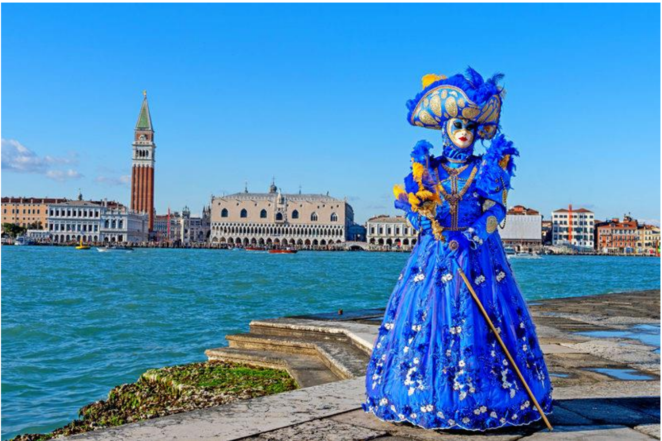
Maske vor der Skyline von Venedig - Aufnahmezeit: 15:35 Uhr

Übrigens: Wenn Sie schon hier sind, besuchen Sie auch den Kirchturm. Im Gegensatz zum Campanile am Markusplatz, gibt es hier KEINE Wartezeiten und die Aussicht ist die beste der ganzen Stadt. Sie werden begeistert sein.