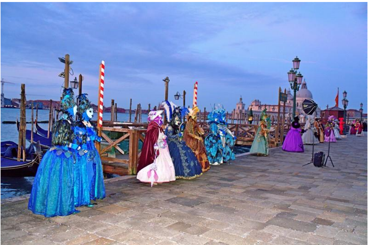
Masken an der Lagune. Aufnahmezeitpunkt: 6:25 Uhr

Aber ohne zusätzliches Licht, stellt der Fotoapparat den ISO Wert schon mal auf Werte über 10.000 ein. Damit ist starkes Bild-Rauschen garantiert.