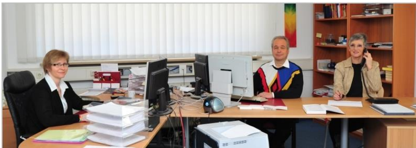
Das Team von Venedig.com www.venedig.com – info@venedig.com

Dieser Reiseführer ist kostenlos und darf für private Zwecke beliebig verwendet und kopiert und weitergegeben werden.