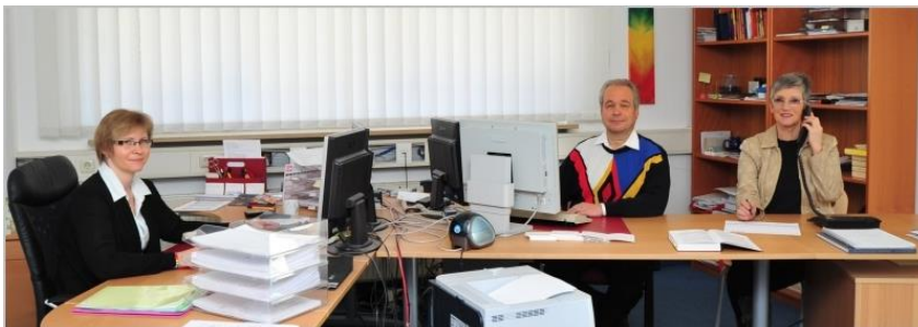
Das Team von Venedig.com www.venedig.com – info@venedig.com

Diesen Ratgeber haben wir nur für die Kunden von Venedig.com und www.Stadtfuehrungen-Venedig.de geschrieben. Für diese gibt es noch eine Reihe weiterer interessanter und kostenloser Reiseführer. Sie finden diese am Ende dieses Reiseführers aufgelistet.