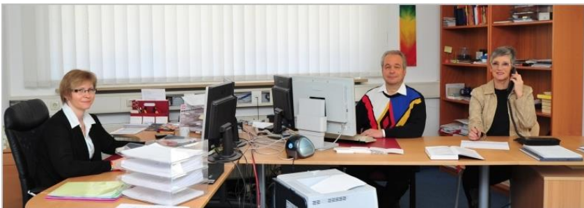
Das Team von Venedig.com www.venedig.com – info@venedig.com

Dieser Reiseführer ist kostenlos und darf für private Zwecke beliebig verwendet und kopiert und weitergegeben werden.