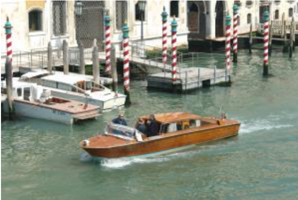
Manche (besonders die guten) Hotels haben einen eigenen Boots Anlegesteg