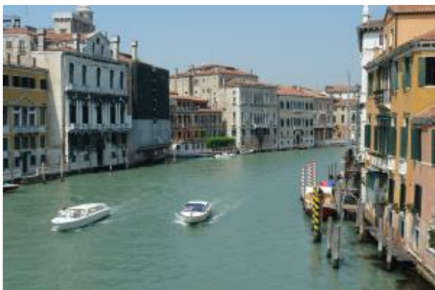
Zwei Taxis auf dem Canal Grande

Das private Wasser-Taxi fährt Sie direkt bis zu Ihrem Hotel. Diese Bequemlichkeit und Geschwindigkeit hat seinen Preis.