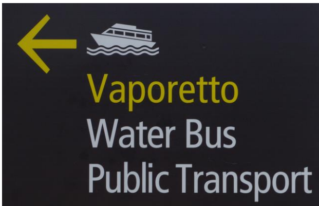
Hinweis Schilder zu den Wasser Taxis

Um zur Anlegestelle der Wassertaxis zu kommen, gehen ebenerdig aus dem Flughafengebäude hinaus, nehmen sofort die Rolltreppe oder den Lift ins erste Stockwerk und benutzen die neuen Laufbänder die Sie entsprechend den Hinweis Schildern in Richtung Wassertaxi Vaporetto bzw. AliLaguna bringen.