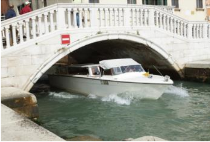
Enger Kanal und Einbahnstraße