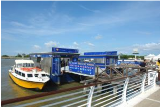
Die Haltestelle der Ali-Laguna am Flughafen Marco Polo