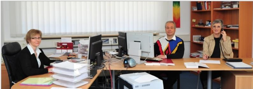
Das Team von Venedig.com www.venedig.com – info@venedig.com

Kostenlos Dieser Reiseführer ist kostenlos und darf für private Zwecke beliebig verwendet und kopiert und weitergegeben werden.