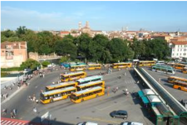
Busbahnhof am Piazzale Roma

Lesen Sie das kostenlose eBook welches Ihnen den öffentlichen Nahverkehr mit den Vaporetti (alle Linien, alle Preise, Ticket Übersicht, etc.) genau erklärt.