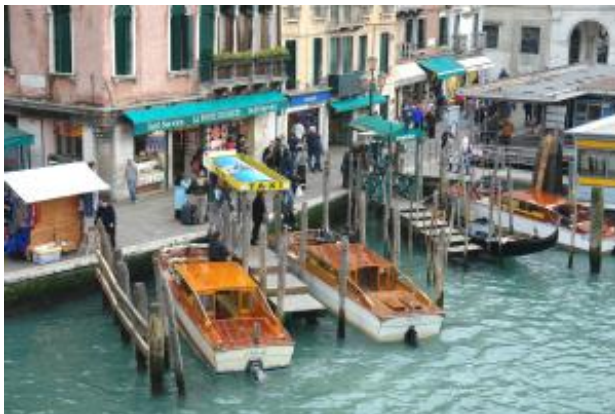
Bei den meisten Hotels hält das Wassertaxi so nahe wie möglich bei dem Hotels