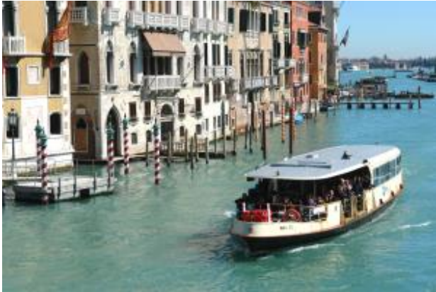
Ein Boote der Linie 1 mitten im Kanal Grande Das Bild entstand an der Brücke über den Kanal am Bahnhof