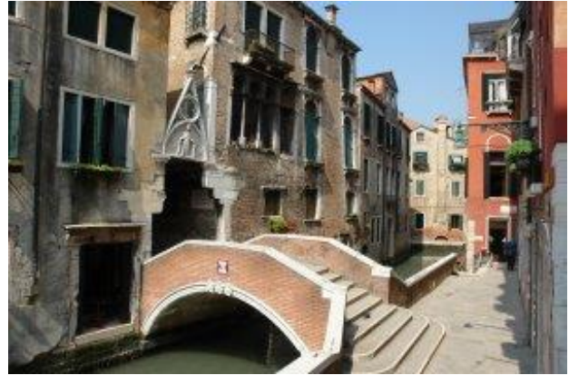
Gassen und kleine Brücken