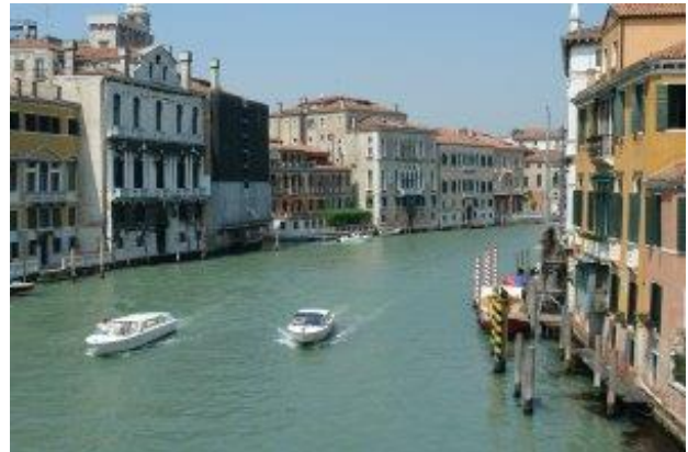
Canal Grande mit Wassertaxi

Insellage Wie Sie sicher schon gehört haben, ist Venedig eine Ansammlung von vielen kleinen Inseln, die mitten in der Lagune der nördlichen Adria liegen.