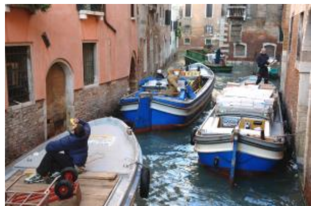
Transportboote in den engen Kanälen