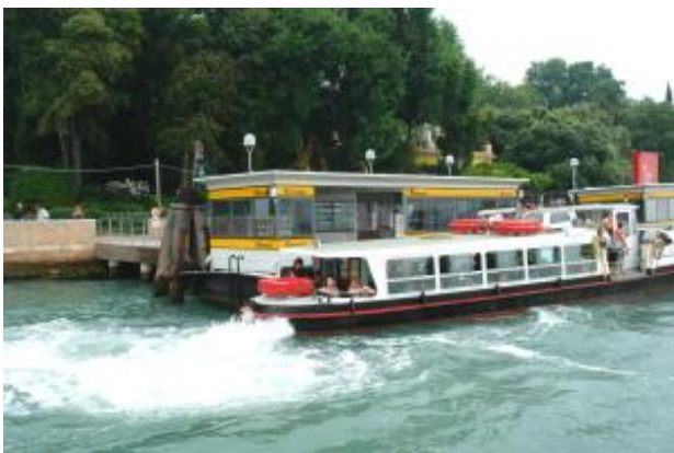
Die "kleinen" Vaporetti

Vorab schon die Information: Eine einfache Fahrt kostet ab 1,40 Euro. Der typische Preis ist 9,50 Euro pro Person. Mit einem oder 24, 48 oder 72 Stunden Ticket fahren Sie natürlich viel günstiger. Dazu lesen Sie später noch mehr.