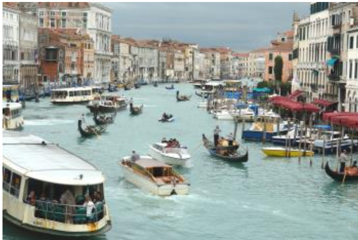
Rush Hour auf dem Canal Grande

Wenn Sie ohne Ticket ein Boot betreten, gehen Sie sofort "zum Schaffner" und kaufen Sie sich ein Ticket.