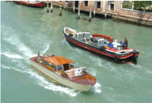
Wasser Taxi und Transport Boot

Viele Transportkähne, Feuerwehr-, Polizei-, Müllabfuhr- Erste Hilfe - Boote machen das scheinbare Durcheinander