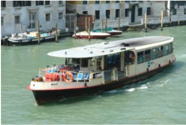
Die "großen" Vaporetti

Das Wort Vaporetto bedeutet "Dampfer". Heute fahren alle Vaporetti natürlich mit Dieselmotoren. Geblieben ist nur der Name.