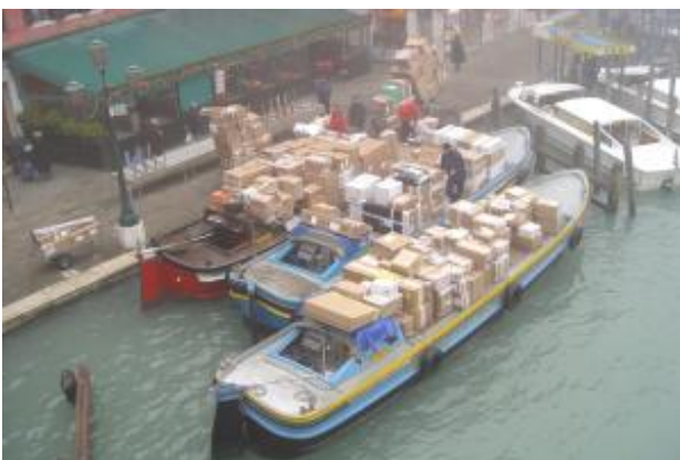
Transport Boote an der Rialto Brücke Das Bild wurde im November aufgenommen

Wenn Sie nur kurze Zeit in Venedig bleiben und Sie sich nur auf der Hauptinsel Venedig konzentrieren, rate ich Ihnen dringend wenigstens für die Anreise und Abreise ein Vaporetto zu nehmen.