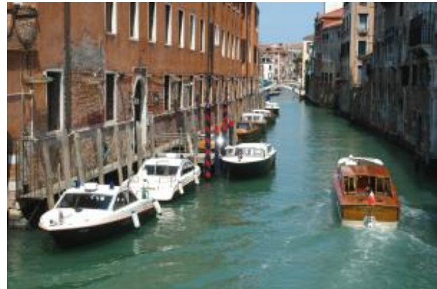
Wasser Taxi und Polizeiboote