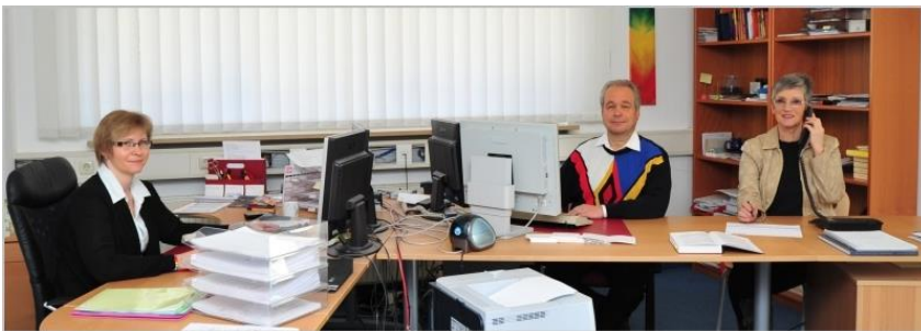
Das Team von Venedig.com www.venedig.com – info@venedig.com

Kostenlos Alle Reiseführer sind kostenlos und dürfen für private Zwecke beliebig verwendet und kopiert und weitergegeben werden.