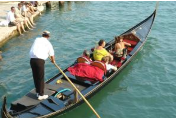
Gondel am Canal Grande