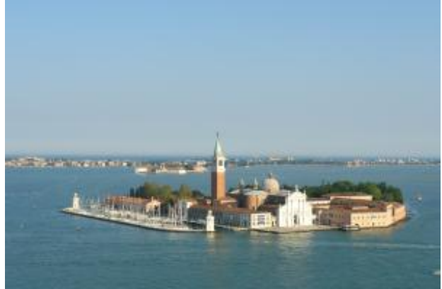
San Giorgio Maggiore