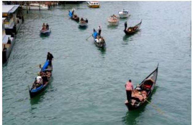
Canal Grande mit Gondeln